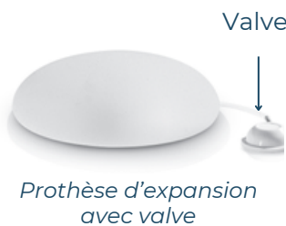
Prothèse d'expansion avec valve